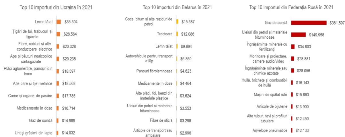
Figură 2 Principalele categorii de bunuri importate din Ucraina, Belarus și Federația Rusă

Producția de mobilă în Republica Moldova depinde de importurile de lemn și articole de lemn din Belarus și Ucraina ($68 milioane). Pentru a nu sista producția e nevoie de substituit aceste importuri cu materie primă importată din țări terțe. O altă categorie afectată sunt importurile de cabluri, fibre și alte conductoare electrice în valoare de $20,3 milioane care erau aduse din Ucraina și sunt critice pentru producția industrială locală. Totodată, industria grea și sectorul construcțiilor este consumatoare de tuburi, țevi și profiluri tubulare din Federația Rusă ($12,4 milioane) care de asemenea necesită a fi substituite.