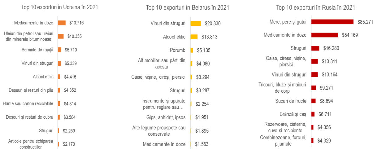
Figură I Principalele categorii de bunuri exportate în Ucraina, Belarus și Federația Rusă

Exporturile Republicii Moldova în Ucraina, Rusia și Belarus sunt afectate de război. Reieșind din volumul anual în 2021, 13,9% din exporturi de bunuri au avut ca destinație această regiune, totalizând $437 milioane. Achitățile cu importatorii din Federația Rusă (exporturi în valoare de $276 milioane) sunt expuse unui risc valutar sporit (doar în ruble) și cheltuieli de transport de câteva ori mai înalte (prin ocolirea zonei afectate de război) 2 . Economia Ucrainei (exporturi în valoare de $79 milioane) este blocată de război, capacitatea de plată a importatorilor este afectată, cererea de consum – redusă ca rezultat al exodului populației și a scăderii puterii de cumpărare. Exporturile în Belarus (în valoare de $68 milioane) sunt expuse unor cheltuieli majorate de transport, cererea de consum fiind afectată de sancțiunile aplicate țării. Diminuarea exporturilor cu 437 milioane dolari SUA ar conduce la o scădere notabilă a PIB-ului.